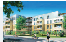
Talence (33) - « Les allées du Prince »