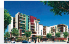
Montpellier (34) - « Carré Sud »