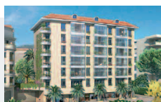
Nice (06) - « So Nice »